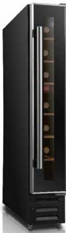
Built-in wine cooler:UBWC150B